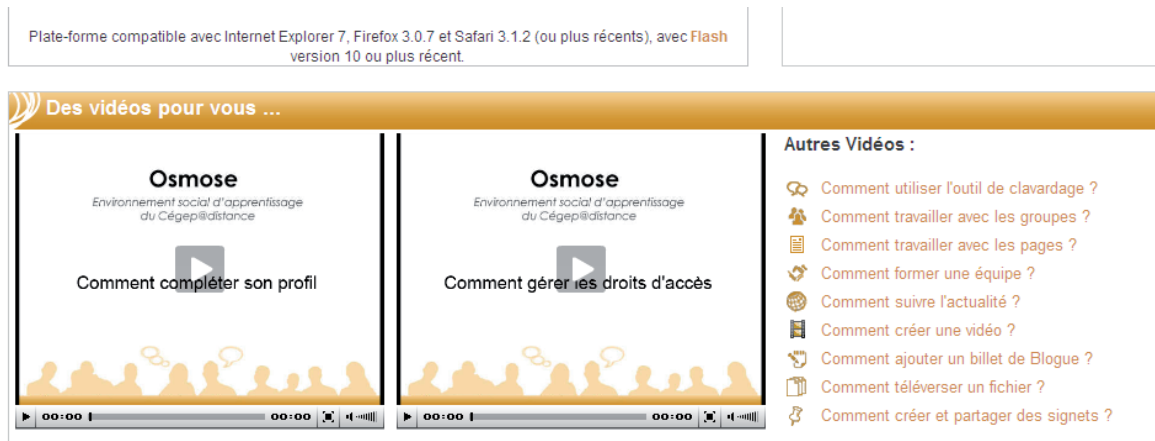
Figure 2. Les capsules vidéos expliquant les différentes fonctionnalités de la plateforme