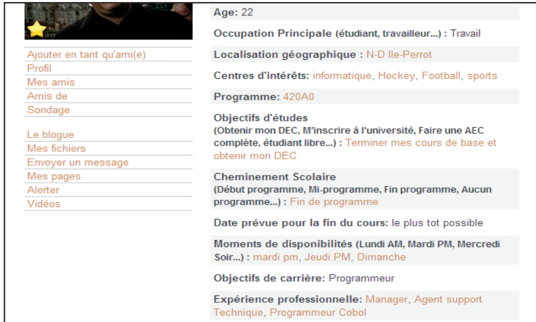
Figure 1. Éléments du profil pour rechercher un pair